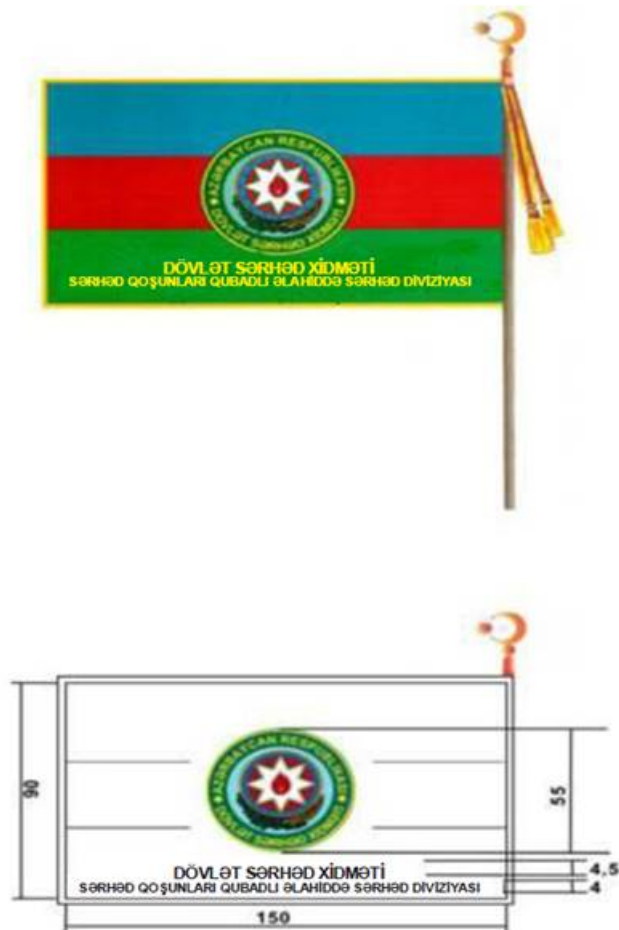
Şəkil 7-1. Qubadlı Əlahiddə Sərhəd Diviziyasının döyüş bayrağı (arxa tərəf)