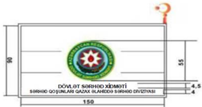
Şəkil 7-2. Qazax Əlahiddə Sərhəd Diviziyasının döyüş bayrağı (arxa tərəf)